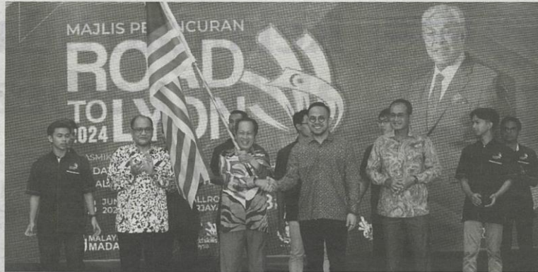
KEJAYAAN belia di Pertandingan Teknikal dan Kemahiran (WSC) penting dalam mengangkat profil aliran Latihan Teknikal dan Vokasional Negara (TVET) dalam kalangan generasi muda di negara ini.