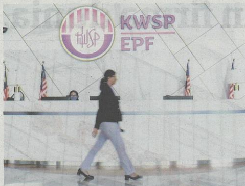
STRUKTUR gaji rendah menjadi faktor utama simpanan KWSP rakyat negara ini tidak mencukupi. - GAMBAR HIASAN

"Langkah ini boleh dilakukan melalui insentif cukai atau kem-