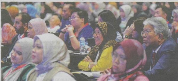
Peserta yang menyertai NHCCE 2024 yang diadakan di MITEC pada Rabu.