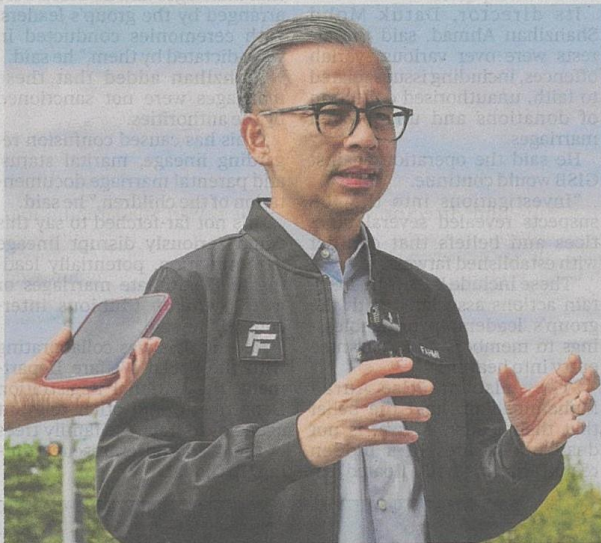
Communications Minister Fahmi Fadzil speaking to reporters in Busan, South Korea, yesterday. He is on a three-day working visit to the country.

Minister willing to act as intermediary between media practitioners and employers